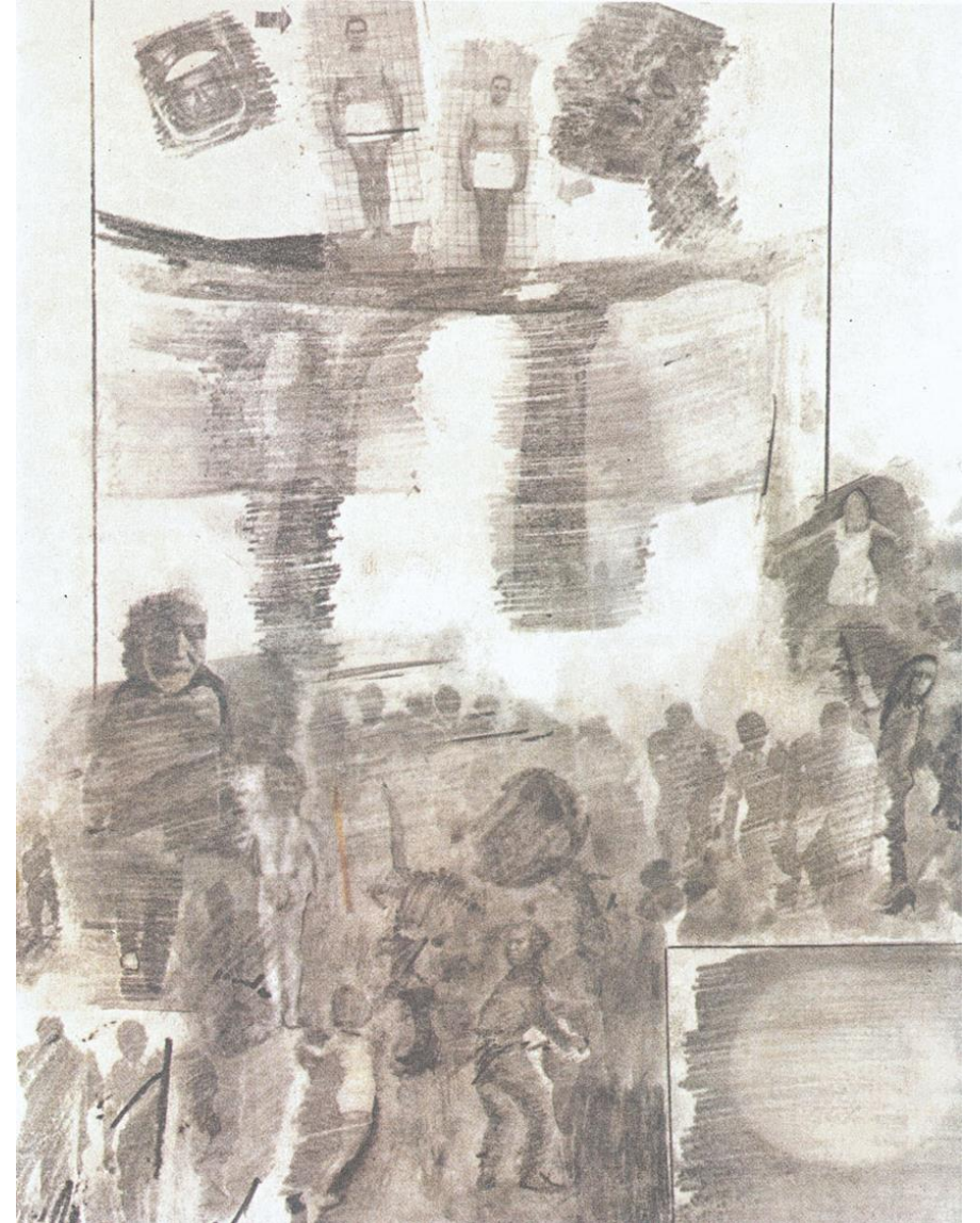
Robert Rauschenberg, Inferno, Canto XX, 1959-1960