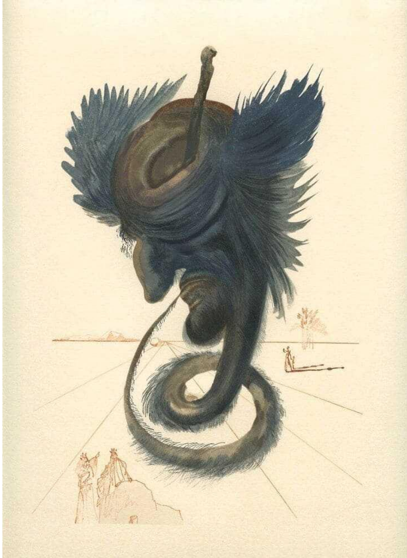
Salvador Dalí, Inferno, Canto XX, 1950-1959