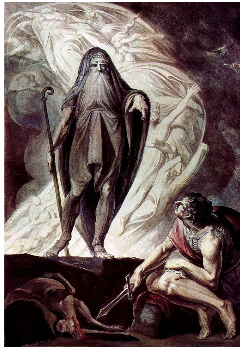
Johann Heinrich Füssli, L'anima di Tiresia appare a Odisseo, 1780-1785